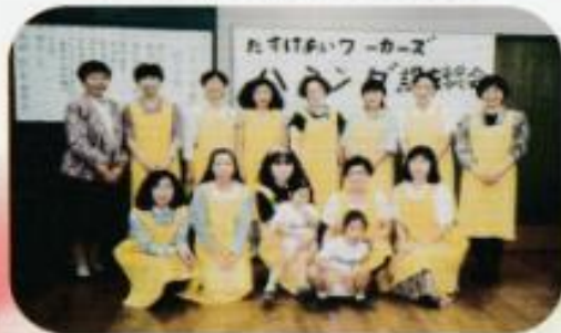
15人でのスタートでした