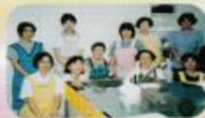
利用者さんを講師に料理教室 「きゅうりのぶったき」 今も作ってまーす